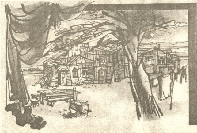
ესკიზი დეკორაციისათვის. მზავარი კარლო ფაჩულია

XOZO. ( შეაწყვეტინებს ) ვიცი, ვიცი... ძალიან... ( ოყინის ) აჰ!.. რომელ სიყვარულზე ლაპარაკობ? ოქროს ბუტყელი იმიტომ გაყიდე... ( ამოიხრებს ) ოპ!.. ოცდაათი წელი ვიცხოვრე და მხოლოდ სიბრალული... მხოლოდ სიბრალული დავიმსახურე... აჰ! სიყვარულის ქვეყანა... მე შენ არ მიყვარხარ, ქელმა! აქამდეც თურმე თვის ვიგყუებდი. ( მკლავში ხელი მოკიდა ) წადი, მაყუთი იშოვე... გესმის,