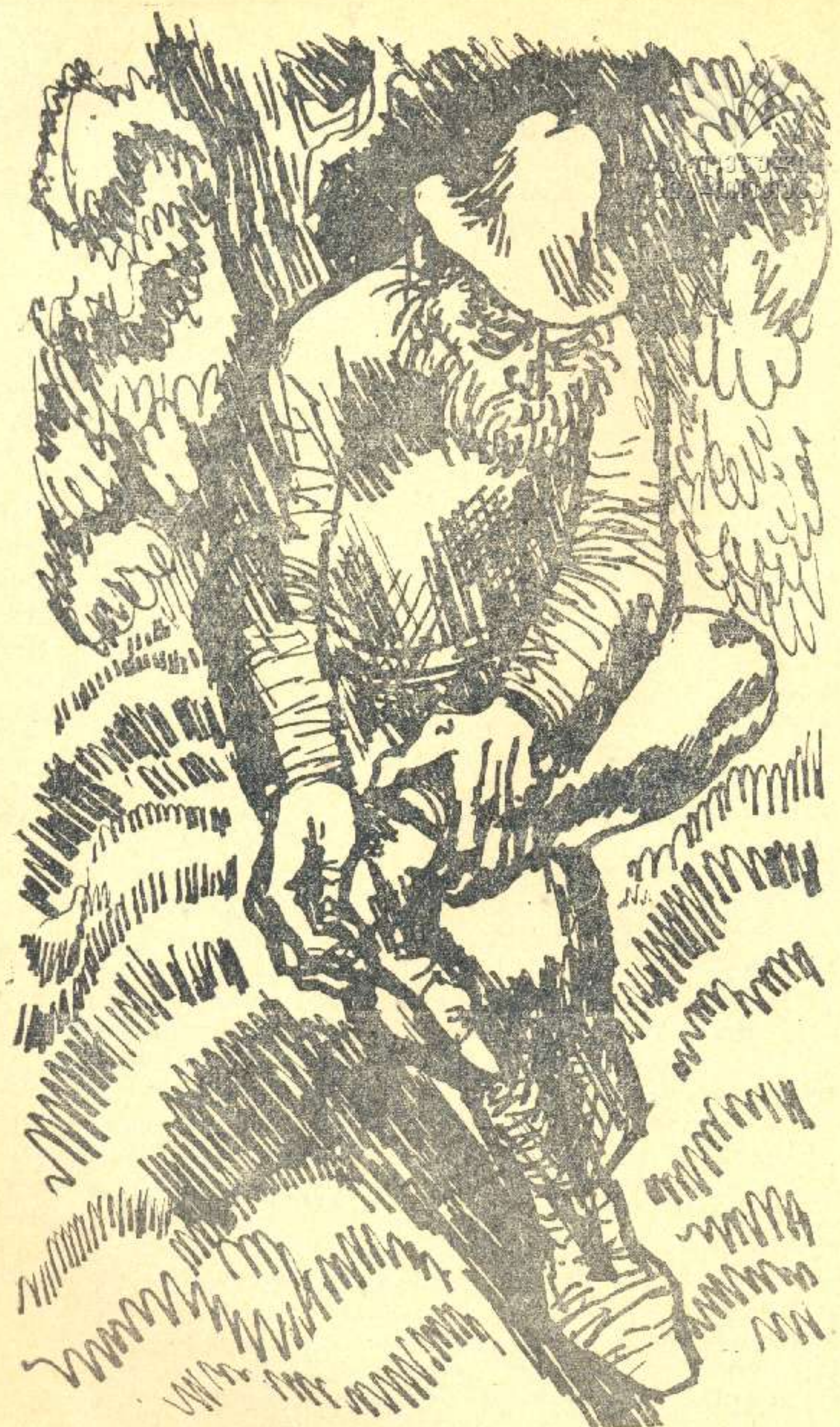
მხატვარი დ. გრისთავი